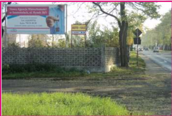
Baner 2 m 2 i Billboard 4x2 m ul. Dworcowa główny przejazd kolejowy w stronę Poznania

Baner i billboard na betonowym płocie. Miejsce ciekawe pod względem umiejscowienia, gdy kierowcy wyjeżdżający z Szamotuł z niedużą prędkością zwracają uwagę na pokazywane reklamy billboardowe (bardzo duży baner, który na takim płocie może mieć duże rozmiary i rzuca się w oczy). Trasa bardzo oblegana przez Szamotulan, prowadząca na Poznań.