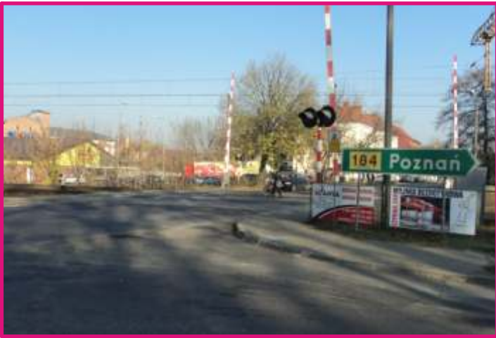
Baner 2 m 2 ul. Wojska Polskiego droga do Pniew

Atrakcyjne miejsce na reklamę dla potencjalnych klientów zamieszkujących miasto Wronki, Obrzycko i okolice. Reklama czytelna nie tylko dla przechodniów, ale i aut jadących tą trasą z niedużą prędkością.