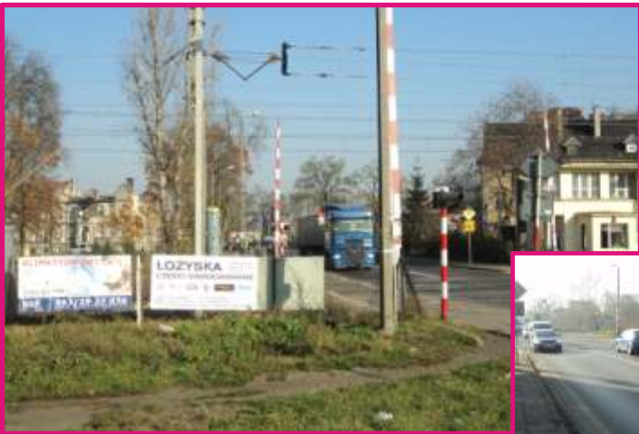
Baner 2 m 2 ul. Dworcowa główny przejazd kolejowy

Miejsce na reklamę w postaci banera reklamowego, znajduje się na przejeździe kolejowym kierującym z Pniew do Szamotuł. Do czasu, wszystkim Szamotulanom znane opuszczanie rogatek sprawia, że kierowcy i przechodnie chętnie zwracają uwagę na wiszące na płocie reklamy.