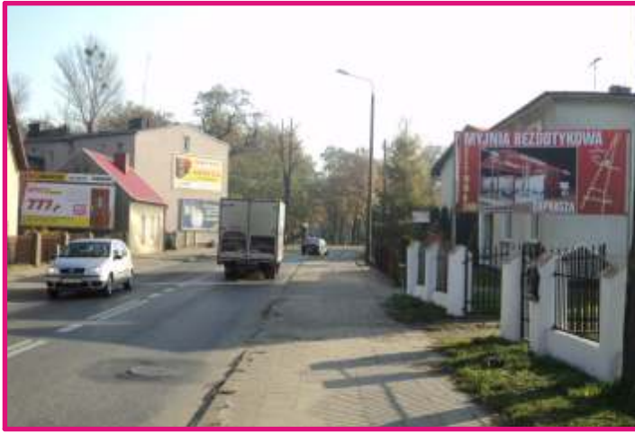
Billboard 8 m 2 1 szt. Szamotuły, ul. Powstańców Wlkp.

Atrakcyjne miejsce na reklamę dla potencjalnych klientów zamieszkujących miasto Wronki, Obrzycko i okolice. Reklama czytelna nie tylko dla przechodniów, ale i aut jadących tą trasą z niedużą prędkością.